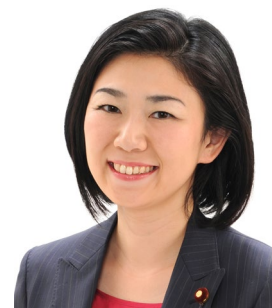
衆議院議員 第2代デジタル大臣 牧島 かれん

講演や討論を通じて、学びや明日からのアクションへの考察を深める貴重な機会です。ぜひ奮ってご参加ください。